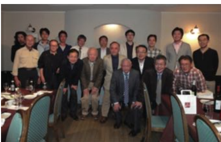
コース終了後の懇親会風景

今まで上流工程のプロジェクトに携わる際は、判断基準や行動基準が自分の中で明確になっておらず、「これでいいのか?」と自問を繰り返すことが多かったと思います。今回のケース研修では、ITによる改革のきっかけ作りからIT導入後の振り返りまでの各工程で必要となる知識を、体系的かつ実践的に習得することができました。この結果、上流工程で必要となる活動の指針が自分の中で確立でき、今までよりも余裕をもった対応ができるようになったと実感しています。