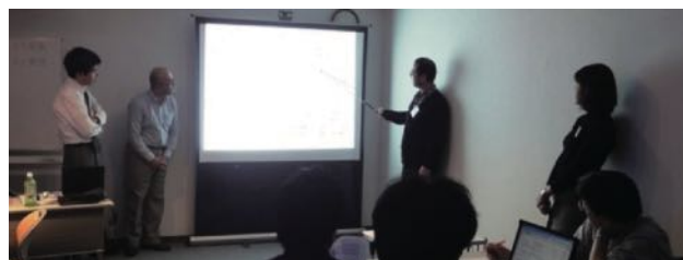
コース最終日のプレゼンテーション風景

ウラ面⇒「お申込み方法」、「具体的なケース研修の流れ」、「ITコーディネータとは」、「ITコーディネータ資格取得のメリット」、「ケース研修受講者の声」、「ITMSについて」