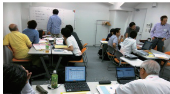
グループ討議風景