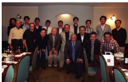
コース終了後の懇親会風景

今まで上流工程のプロジェクトに携わる際は、判断基準や行動基準が自分の中で明確になっておらず、「これでいいのか?」と自問を繰り返すことが多かったと思います。今回のケース研修では、ITによる改革のきっかけ作りからIT導入後の振り返りまでの各工程で必要となる知識を、体系的かつ実践的に習得することができました。この結果、上流工程で必要となる活動の指針が自分の中で確立でき、今までよりも余裕をもった対応ができるようになったと実感しています。