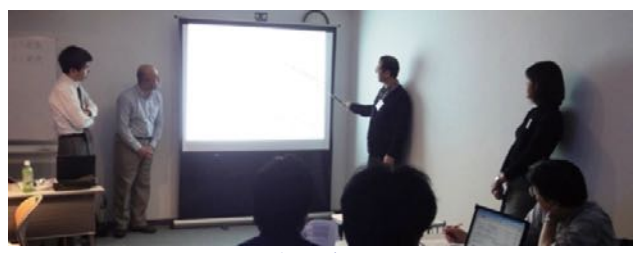
コース最終日のプレゼンテーション風景

ウラ面⇒「お申込み方法」、「具体的なケース研修の流れ」、「ITコーディネータとは」、「ITコーディネータ資格取得のメリット」、「ケース研修受講者の声」、「ITMSについて」