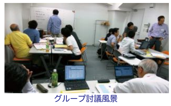
グループ討議風景